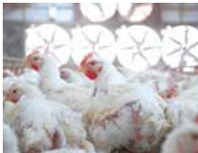
鹿児島いいとこ鶏