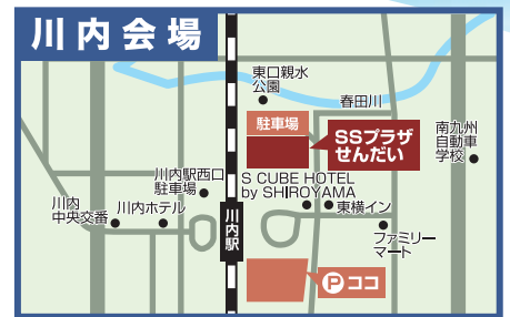
駐車場有:川内駅平佐口(東口)駐車場Dパーキング